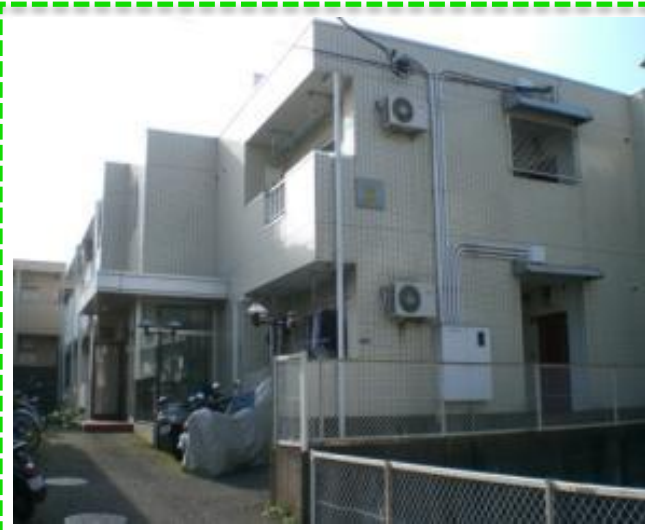
HPIに動画を掲載! より詳しくお部屋の様子をご覧ください。